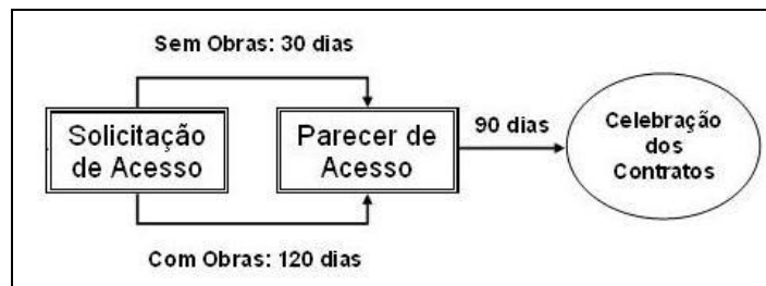
Figura 1 – Etapas de acesso obrigatórias para consumidores livres e especiais e centrais geradoras solicitantes de registro